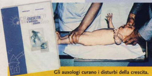
Gli auxologi curano i disturbi della crescita.

Un genitore si trova spesso impreparato di fronte alla crescita staturale, ponderale e sessuale del proprio figlio, non sapendo a chi chiedere consiglio, con il dubbio di esagerare con preoccupazioni ingiustificate o, al contra-